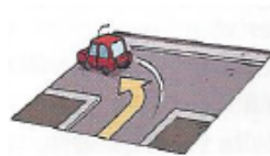
Girare a sinistra