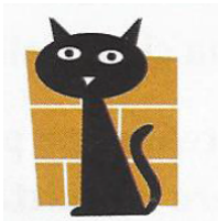
Davanti Girare a destra

B) Per indicare la strada : distribuer le doc. Lessico CO -Le direzioni _ Qq preposizioni de lieu