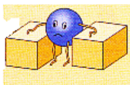
Andare dritto Di fronte a